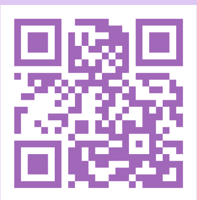
គេហទំព័រ រកស៊ី