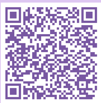
រកស៊ីឆាតបុត