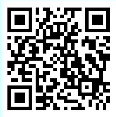
គេហទំព័រ Facebook ពិដោរអ្នកភូមិឆ្លាតវៃ

សម្រាប់ព័ត៌មានលម្អិតបន្ថែម និងការចូលមើលផ្ទាំងទិន្នន័យ សូមចូលទៅកាន់គេហទំព័រពិដោរអ្នកភូមិឆ្លាតវៃ ( https://pidordashboard.org/ ) និងទំព័រ Facebook របស់ពិដោរអ្នកភូមិឆ្លាតវៃ។